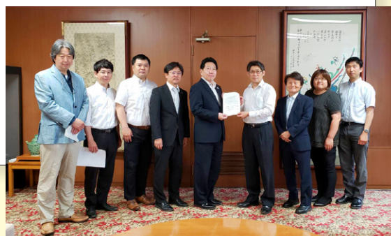
▲中野区長(中央)に党議員団と地区委員会が申し入れ